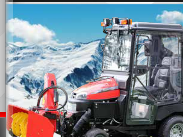
vyhřívaná kabina a sněhová fréza