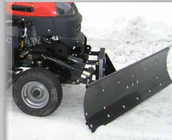
hydraulický přední závěs a radlice 140 cm