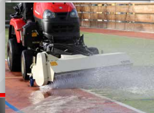
univerzální zametací kartáč