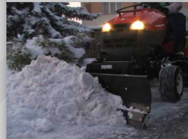
profi radlice 140 cm na předním závěsu